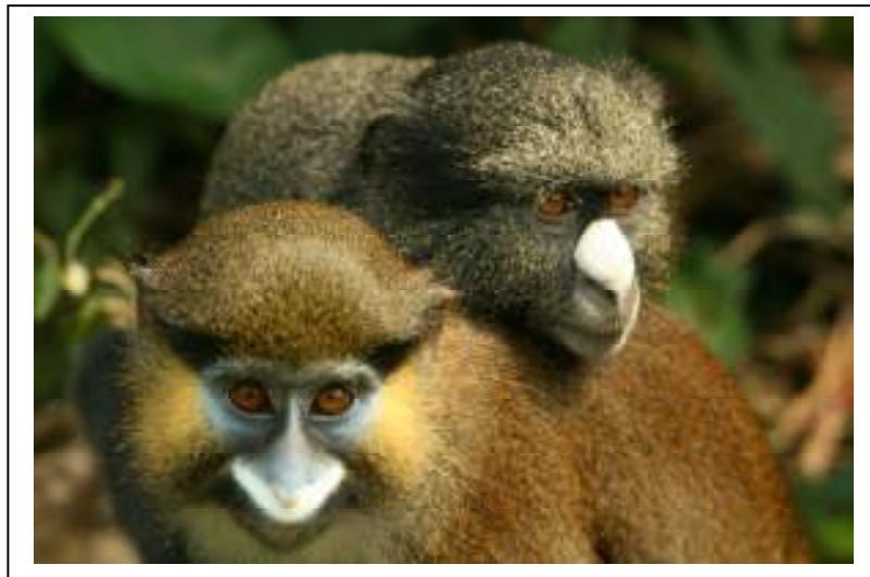
Guenones rescatados en un santuario de PASA

Cada día, la Alianza Panafricana de Santuarios trabaja para salvar la vida -y el futuro- de gorilas y chimpancés, bonobos y driles, babuinos y muchos más. Juntos podemos hacer la diferencia.