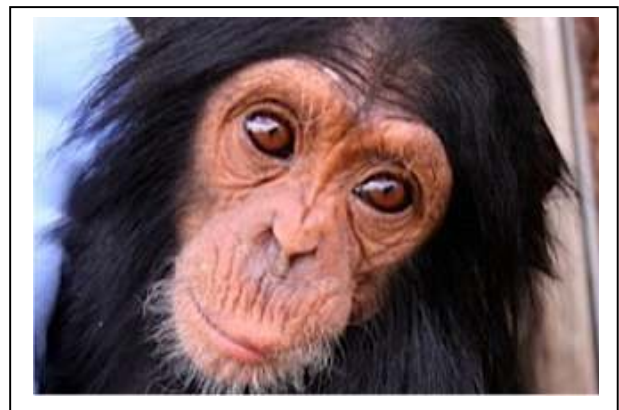
Bebe chimpancé rescatado

PASA es la única organización que abarca tanto el trabajo de conservación como el cuidado en cautiverio. Ninguna otra ONG aborda conjuntamente la protección forestal, la aplicación de la ley, la educación, la atención veterinaria, la capacitación en gestión, las relaciones con los gobiernos, la política internacional y la ciencia de la conservación como lo hace PASA, dentro de sus posibilidades.