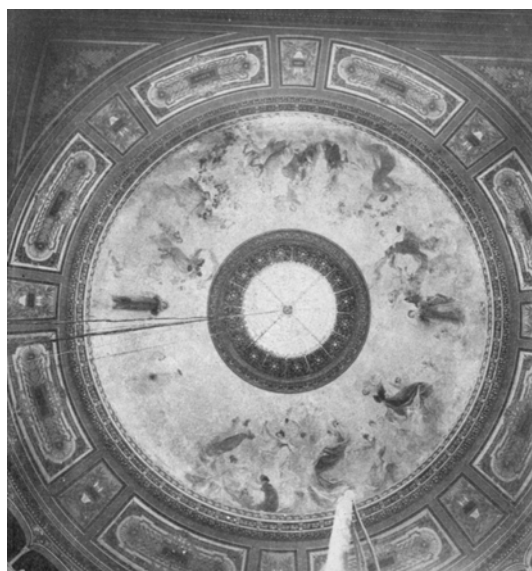
Plafond original hoy desaparecido

La fotografía del plafond original, única imagen en la que se ve en forma completa y que se reproduce en este artículo, fue tomada del suplemento especial de La Revista Artística de Buenos Aires . 14