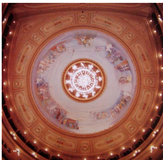
Plafond actual realizado por el artista Raúl Soldi

En el caso del Colón, las pinturas originales ya no existían y la nueva ornamentación fue colocada directamente sobre la superficie de yeso reconstruida en la cúpula. Este trabajo abarcó los meses de diciembre de 1965 y enero, febrero y parte de marzo de 1966. 3 El motivo y los tonos elegidos por el artista, son de fuerte contraste con las demás pinturas que decoran la Sala, siguiendo un concepto similar al elegido por el artista Chagall para el plafond de la Ópera de París, que coincide con el gusto de la época y perseguía - según el artista Soldi - utilizando los dominantes tonos verde Veronés mezclados con blanco, dar la sensación de altura y liviandad.