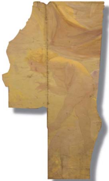
Fragmento I encontrado perteneciente al plafond original