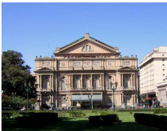
Fig. 1: Vista del Teatro Colón

Se recurrió al relevamiento de las noticias del día a día, sobre todo lo referente a la construcción del Teatro, lo que implicó la lectura de más de 2.900 diarios y una cantidad similar de otros documentos como actas, memorias y anuarios municipales. Se hizo un relevamiento fotográfico de las pinturas y técnico de las estructuras que las soportan; se analizaron muestras tomadas de fragmentos encontrados del plafond original y de los soportes de las mismas 2 ; muestras de los materiales de las estructuras a las que se adhirieron dichos soportes; entrevistas a informantes clave y consultas técnicas a profesionales idóneos en cada materia.