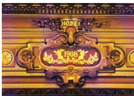
Fig. 2: El 25 de mayo de 2008 el Teatro Colón ha cumplido 100 años