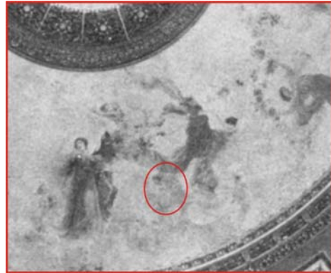
Localización del fragmento I en el plafond original